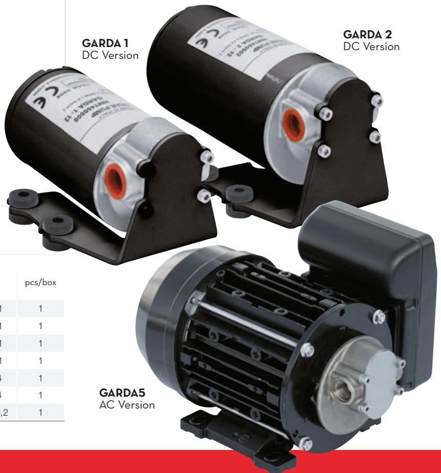
GARDA5 AC Version