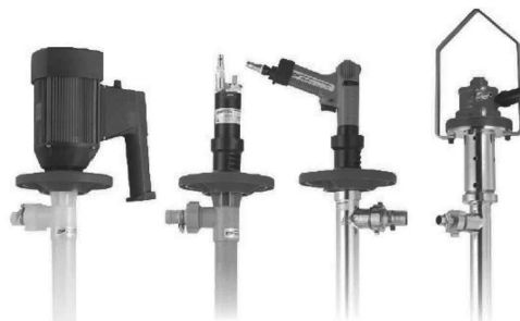
HD-E1-V HD-E2-V-US HD-E2-V-UK HD-E2-V-EU